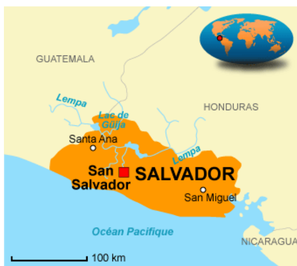
Carte du Salvador, pays d'Amérique Centrale